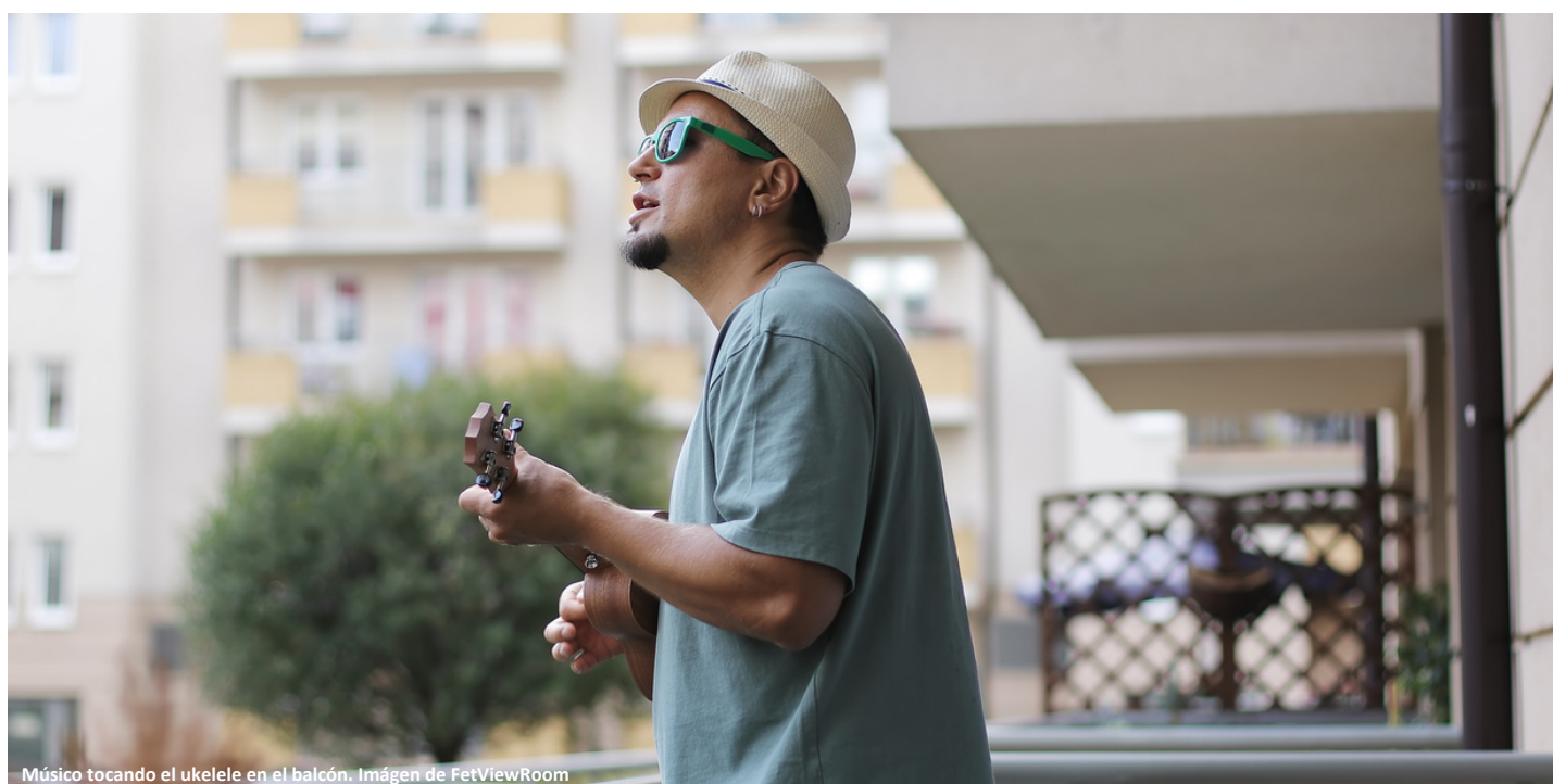
Músico tocando el ukelele en el balcón.

Solidaridad y resiliencia son dos claves de la nueva realidad de las entidades de gestión de América Latina y el Caribe. Ello se manifiesta en el apoyo decidido a los creadores, y la gestión efectiva de sus derechos, especialmente en los medios digitales.