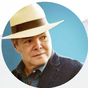
Arturo Márquez Vicepresidente de la CISAC y renombrado compositor mexicano.

La CISAC ha lanzado una campaña, en alianza con YMYF International, para dar más información acerca de los perjuicios de esta práctica y de cómo los autores y las organizaciones de gestión colectiva podrían oponerse a ella y al mismo tiempo impulsar iniciativas para proponer a los hacedores de políticas públicas y a los legisladores proyectos de ley que permitan a los autores recibir, de forma justa y proporcional, los beneficios derivados de la explotación de sus obras.